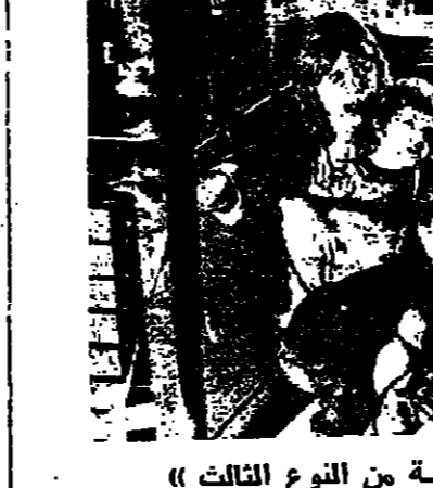
لقطة من « لقاءات » قريبة من النوع الثالث

وربما يكون الكوميدي الشهير الراحل تشارلي تشابلان اول من ألمح الى هذه النظرة القاتمة في العلاقة ما بين الانسان والآلة او اول من حاول ابرازها من قضية سينمائية او لا تحمل اية ابعاد الى طرحها كقضية ذات ابعاد شتى سياسية واقتصادية في فيلمه « العصر الحديث » حيث تتسوق فيه الآلة التي يسيطر عليها الراسمال كل للذخخ الإنسانية لسان ذلك العصر المظنون بتفاهيه الاستغلابية والمخوف تحت وطأة هذه الغايم بحيث يتخلى عن كلمة مواصفاته الإنسانية ليصبح